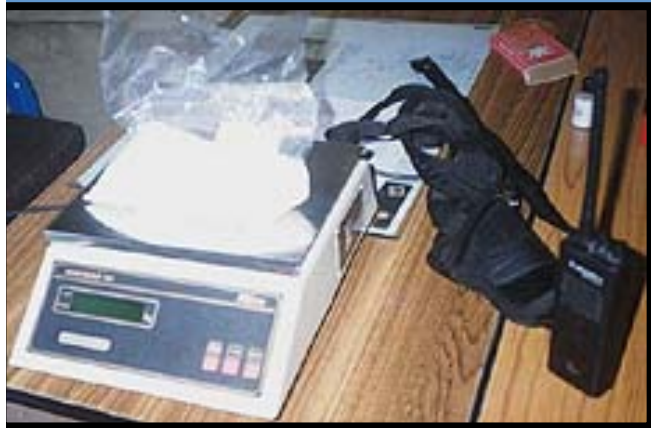
Tráfico de drogas