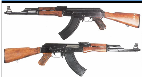
Tráfico de armas